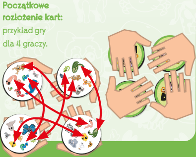
Początkowe rozłożenie kart: przykład gry dla 4 graczy.

4) Jak wygrać? Zwycięża gracz, który na koniec ostatniej rundy ma najmniej kart.