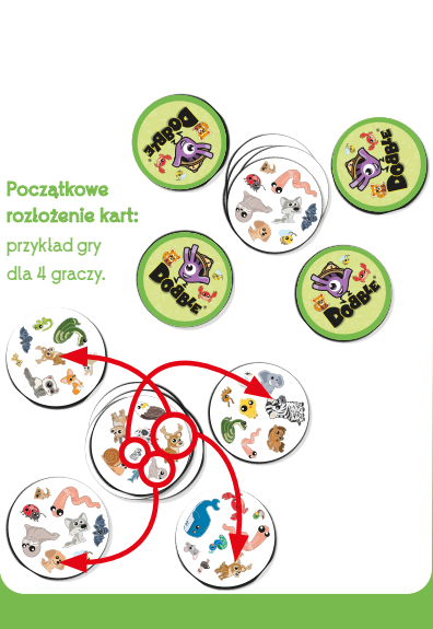
Początkowe rozłożenie kart: przykład gry dla 4 graczy.

4) Jak wygrać? Zwycięża gracz z najmniejszą liczbą kart.