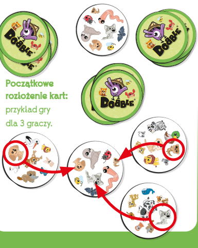
Początkowe rozłożenie kart: przykład gry dla 3 graczy.

4) Jak wygrać? Zwycięża gracz, który jako pierwszy pozbędzie się wszystkich kart.