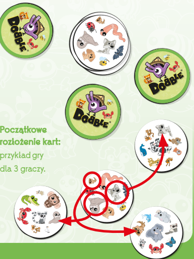
Początkowe rozłożenie kart: przykład gry dla 3 graczy.

4) Jak wygrać? Zwycięża gracz, który zdobył najwięcej kart.