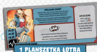
1 PLANSZETKA ŁOTRA