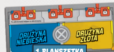
1 PLANSZETKA OBRAŻEŃ