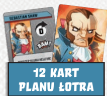
12 KART PLANU ŁOTRA