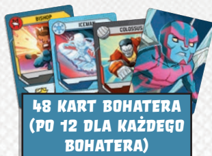
48 KART BOHATERA (PO 12 DLA KAŻDEGO BOHATERA)