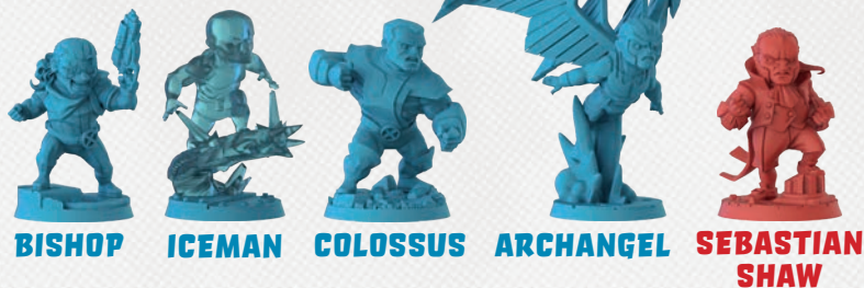
BISHOP ICEMAN COLOSSUS ARCHANGEL SEBASTIAN SHAW