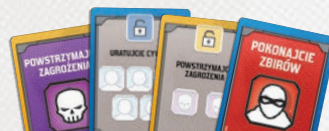
6 KART MISJI DRUŻYNY (3 NIEBIESKIE I 3 ŻŁOTE)